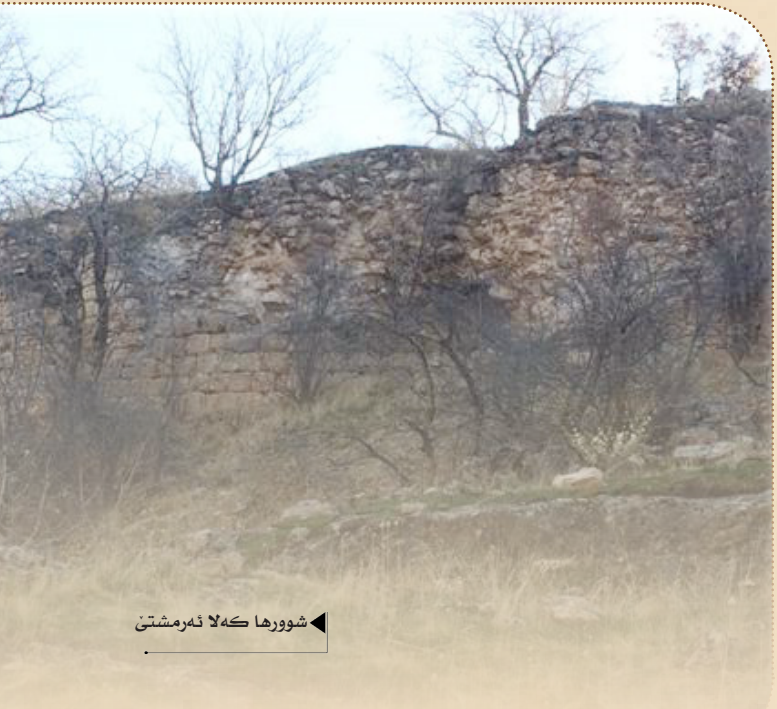
شووهره که لا نه رمشتی

وههروهسا (مسکویه) سنی جاران بهحسی که لها نه رمشتی کریه، جارک دگهل روودانین سالا (٣٦٠/ک/٩٧١)، د ناختنا خودا ل سهر هه فکریا دناقههرا (حمدان بن ناصر الدولة الحمدانی)، و برا یین وی (مسکویه) د ناختنا خودا بهحسی هه فکریا دناقههرا (حمدان بن ناصر الدولة) و برا یی وی (أبي البركات)، و برا یی وی ییدی (أبي تغلب) کریه، هه ولدانین وان هه میان ژبو سه پاندنا دهستهه لاتا خوهل سهر کیستی یی دی، ژیهه کو دماوی قی هه فکریی دا (حمدان) ی ئیدانهک ل سهر برا یی خوه (أبي البركات) ی دا و نهو ب عه ردی که ت، و نهو وهکو ئیخسیرکرت و نهو بریندار بوو، و نهو بره (قرقیسیا) ژبو چاره سه رکنا برا یی خو ژوی ئیدانی نهوی وهسا ههز دکر کو نهو دی ساخلهم بت به ئی نهو پشتی هینگی ب دهه کی کیم مر، و نهو کره د سندر ووکی (تابووت) دا و بره مووسل و نهفه بوو نه که ری توند بوونا هه فکریی دناقههرا وی و برا یی وی (أبي تغلب) ی، و برا یین دی ژی ژیک جودا بین و دهست داهیلان و ملامانی دکرن و ههروهسا بژاله بین دکارین خوه دا، کههستهه (أبي تغلب) ی کو (محمد) دناق وانادا یی بهرنیاس ب (أبا الفوارس) نهوی دهستهه لات ل نسبیینی دکر، و نهوی نفیسه نهک دا (حمدان) ی و نهوی کارکر داکو خو بکه هینتی