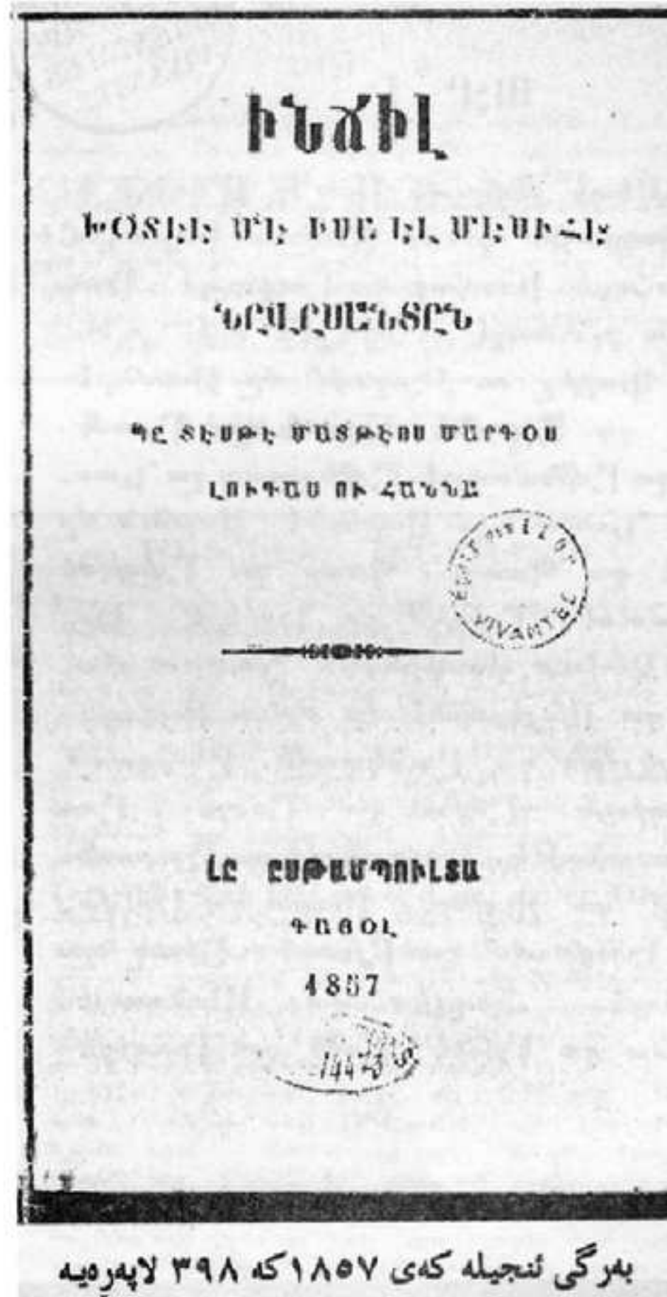
به رگی ئنجیله که ی ۱۸۵۷ که ۳۹۸ لاپه ریه

ئه ق راستییه نابیته نه گه ره کو قی چهندی رهت بکه مین کو کوردان جارنا هنده ک دهستنقیسین خو ب زمانی خو یی کوردی نقیسینه، هه وه کو هنده ک ژ وان هاتینه قه دیتن و بی گومان هنده کین دی ژی ل پاشه روژی دی خویا بن چونکه نه گه ره دو یقچوونا