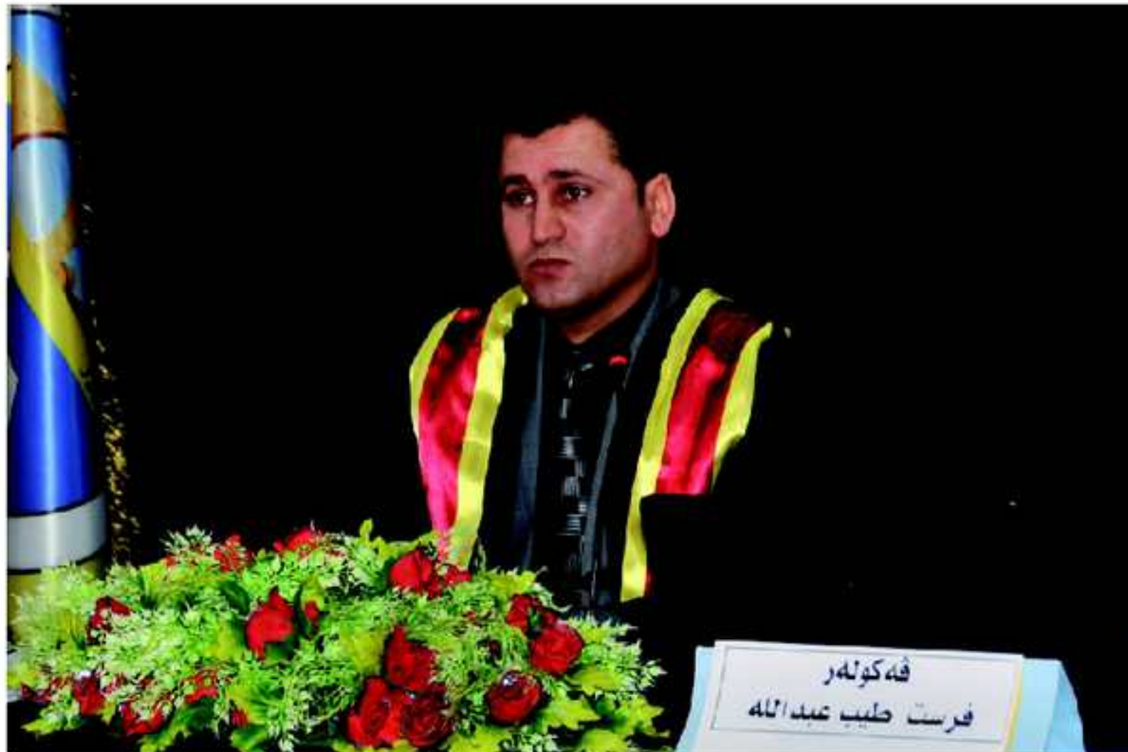
گهنگهشا ناما ماستهري، قوتابي (فرست تهيب)ل پشکا ميژوو لثيرناڤ و نيشان: (تيكه تيا قوتابيين كوردستاني) هاته ئه نجام دان ل ريكهفتي ۲۰۱۲.۳.۸ ل فاكولتيا زانست - زانكوبازاخو