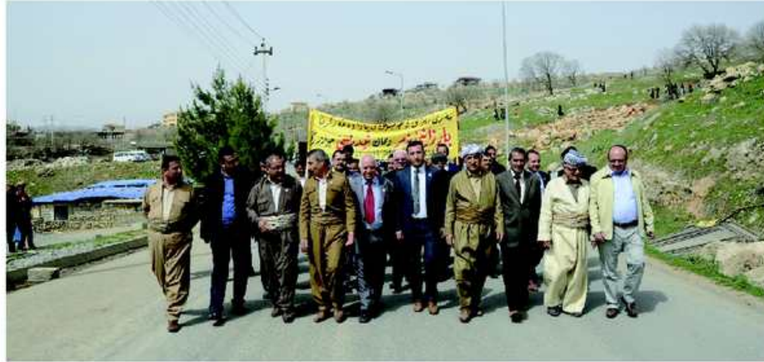
چوونا شاندى سه روکاتيا زانکویا زاخو بوسه مزاری نه مران ل روژا چوارشه مبی ریکهفتی ۱۴/۳/۲۰۱۲ ی.