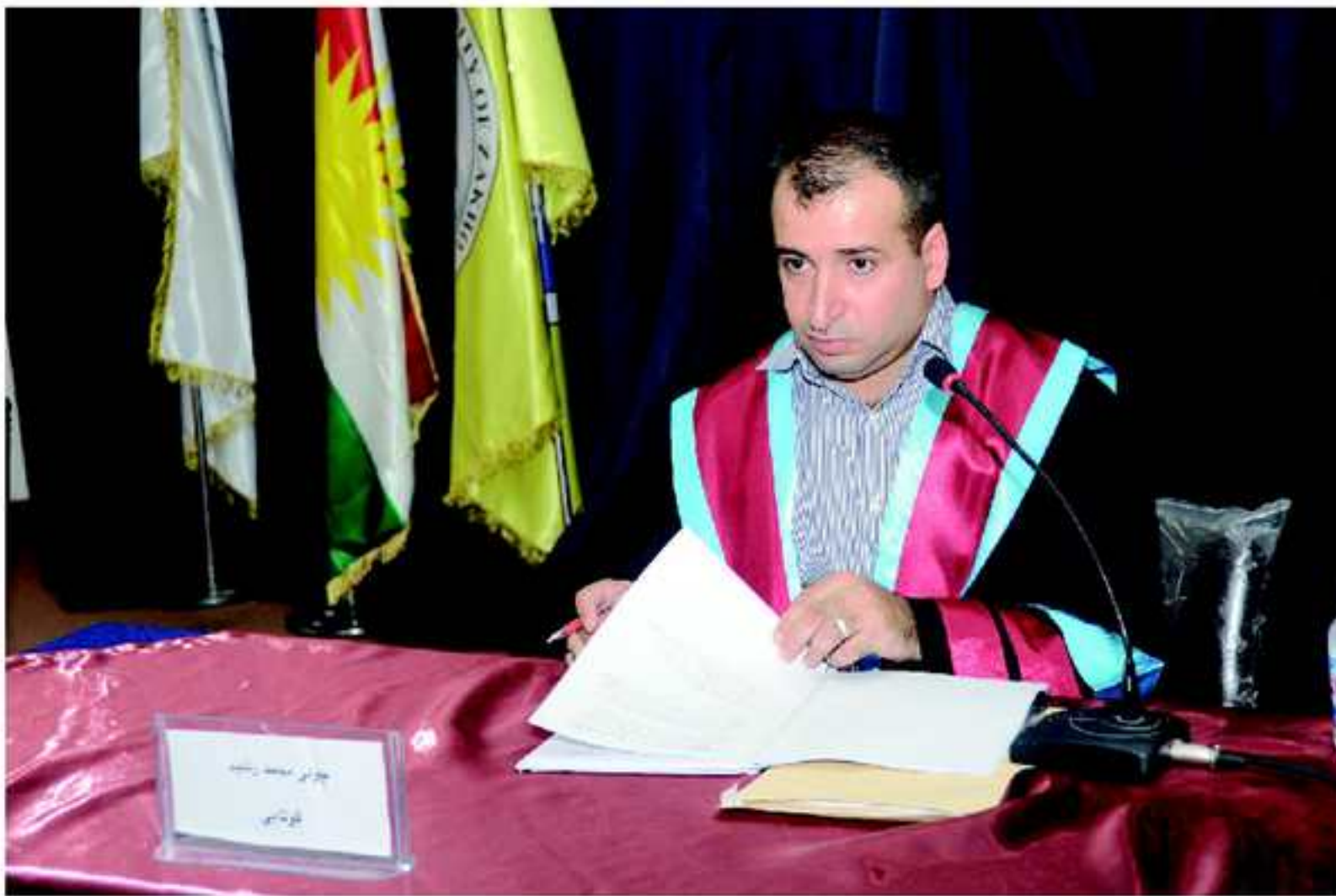
چولی محهمه د رهشید، پشکا ماتماتیک، ماستەر، ۱۳/۹/۲۰۱۱ NUMEICAL SOLUTION FOR GRAY_SCOTT MODEL BY FDM, SAM,MSAM AND ADM