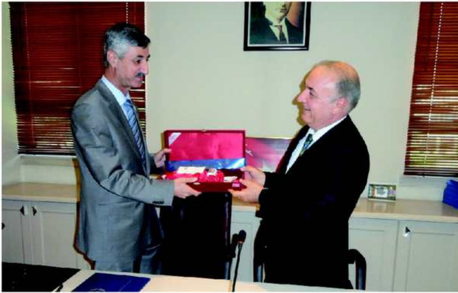
مههمهت ئوز ئهسلان ( ناماده ببوون .

ل دهستپینکا دیداری، سهروکی زانکویا عننتاب ب خیرهاتنهکا گهرم ل مینهفانان کر و کورتیهک لسهر زانکویا عننتاب پیشکیش کر و ههزا خوه لسهر گریدانا پهیوهندیین زانستی، رهوشهنبیری و کومهلایهتی... هتد، دگهل زانکویا زاخو دیار کر؛ سهروکی زانکوی بیاس ل فاکولتیین زانکوی کر کو هژمارا وان 14 نه و ژ هژمارهکا زوریا سکولان پینکدهیت، ل دويفدا سهروکی زانکوی زاخو پهیشهکا سوپاسی و ریزگرتنی لسهر پیشوازییا وان پیشکیش کر و دهستخوهشی لسهر ههزا وان بو گریدانا فان جوهره پهیوهندیان کر. بهریز سهروکی زانکوی ناماژه دا کو ههههچهنده زانکویا زاخو زانکویهکا ساقایه و تهمنهتی وی ب تنی سالهکه لی دهستپینکا پهیدابوونا وی وهک زانکو بو دهستپینکا ساله 2004 ی دزقریتهقه و فاکولتیین زانستی و زانستین مروقایهتی ب خوهقه دگریت و ژ 11 پشکان پینکدهیت، کو 5 ژی زانستینه و 6 ژی مروقایهتینه، زیدهباری فهکرنا دوو پشکین نووی نهوژی پشکا زانستین ژینگههی