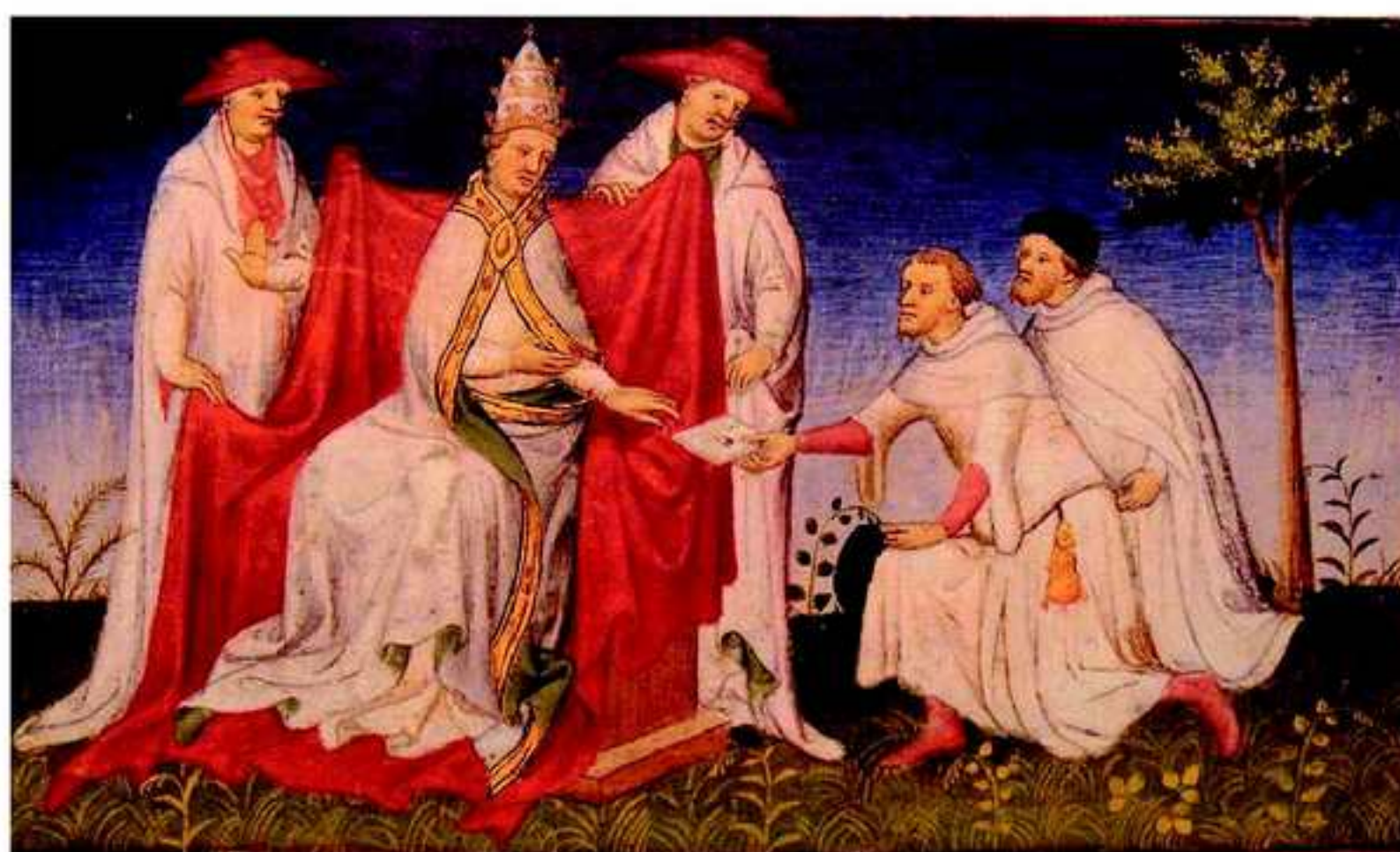
نیکولو و مافیو پولو نامهیا قوبیلای خانی پیشکیشی پاپا گریگورینی دههنی دکهن. ۱۲۷۱ز

صومای ( ل دووماهیا چریا ئیکئی و دهستیپیکا چریا دووی ) قهستا باژییری بوردو کرو چوو دهف شاهئی ئینگلترا ئیدواردی ئیکئی، نهوی ژی - وهکی شاهئی فهرهنسا. ب روویهکی گهش خیرهاتن ب نوونهری مهغولان کر، بهلی هیچ ئیک ژوان پیشنیارا ههفکاریا لهشکهری کومهرهما سههرهکیا شانندی رهبان صومای بوو پهسهندنه کرن (گروسه، ۱۳۶۸، ص ۱۱۶). صوما فهگهریا بوروما و پاپا نیکولایی چواری سوز دایی هاریکاریا وی بکتهت، پاشی ل دووماهیا هاقینا ۱۲۸۸ دگهل نامهیین پاپا نیکولایی چواری و فلیپ لوبل و ئیدواردی ئیکئی فهگهریا بودهف ناراغونی، و وهک سوپاسی و ریزگرتن بووی ناراغونی فهرماندا کو که نیسهیهک ب رهخ په رستگهه و کوونی [چادرا] و یقه بهیته ئافاکرن و چ