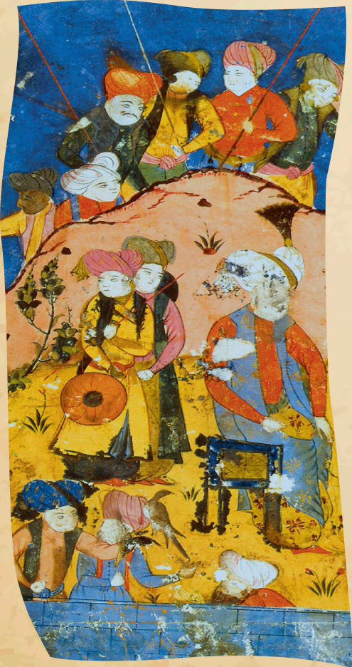
مہجلیسا شہرہ فخانہ بدلیسی تابلویک ژ پرتووکا شہرہ فنامہ