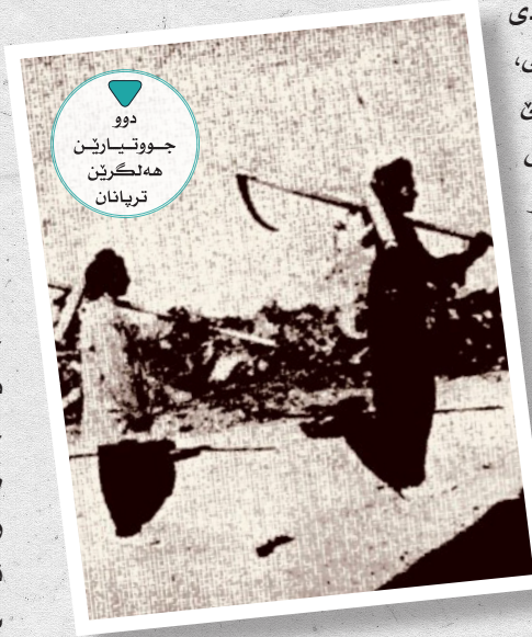
دوو جووتيارىن ھەلگىرئ تریانان

ژنان ل دەمى بىكارىي ب كارىن رىستىن رادبن و گورەپىن ستویر و ب سەرۋىەر د رىسن. ل زڤستانى كۆ ب شىوہىەك گشتى كارىن چاندنئ دەھىتە پراوستاندن، ژن و مىر ل دەف ھەقدو كۆم دبن دەست ب ئاخقتىن خومش و قەگىرانا چىرۆكان دكەن. د ناف ئەقى ھۆزىدا، ئەفسانە، مەتلوك، مامكىن زىدە ژلايى ھىژا (مەجىد زادە) ھاتىنە كۆمكرن كۆ نمونەپىن ئەوان ل خوارى ھاتىنە و ب ئەوى ئومىدئ كۆ تەقايان ئەوان د پەرتووكەكا جودا دا بەھىتە چاپكرن. ھەژى گۆتئىيە كۆ پترىيا چىرۆكىن ئەفسانەيى ل شەقن درىژىن زڤستانئ دەھىنە گۆتن كۆ ب رۆژ بىكارن د شىيىن ب شەف ھەتا درەنگ ھىيار بمىنن.