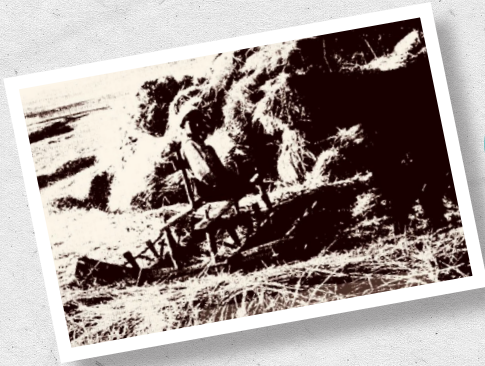
بىدار دناق ھۆزا مامەش - گوندئ پەسود

گرنگىرئ كەلوپەلئىن كۆ دكرن ب ئەقى شىوہى ل