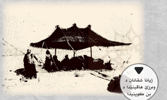
ژیانا شقانان د ومرزی هافینیدا د بن کۆینیدا

پوین، نیفشک، سەرتیک، قەیماع، کەشک، ماست و دمو. ژبو دروستکرنا نیفشکی ل دەستپیک سە داران دەینن و د ئەردی د چکلین و سەری ئەوئ ژ پەخ سەریقه ددانە ل سەرتیک هەتا ب شیومیهکی هەرمیعی سە تەنشتی لیبهیت. هۆزا زرزا ئەفان هەر سە پیکان ب (سەپەک) ناڤ دکن. ئەفجا ئەو ئالافی نیفشکگر مینا بەرمیلکەکا داری یه و د نیفا ئەویدا کونەکا هەمی کو ئەوئ ب بەنکی ب هەر سە پیکانقە د هلاویسن و دمو ژبو چیکرنا نیفشکی دکنە دناڤا و هند د شلقین هاته نیفشک جودا دبیت و ئەف ئالافە ب (نیر) ناڤدکن.