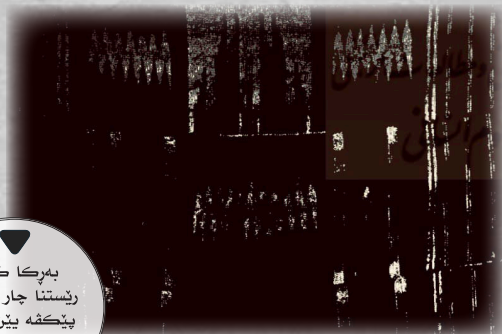
بەرکا کو ژ رێستنا چار قەدەین پیکهه بین ئەوئ دبیتە بەرکا مەزنا لاکێشه

ژ ئەوئ تاشا هاتییهگۆتن هەتا رێژهیهکی ژیان و پیشه و بەرهمین هۆزا زرزا هاته زانین. هەروسا ل سەری هاته دیارکرن کو ئەرد ددەستین خودان ئەردین کیم دایه کو هەر جۆره بەرهم یح ئەوانایه و هەر ئەون دەست ب کپین و فرۆتن دکن. پتیرا کپین و فرۆتن بەرهم دناڤ زرزا ب خوه ب شیومیع کاشه و کیمتر پیکگوهۆرینا پەرتالا دهیتە کرن. لئ کپین و فرۆتن ل گەل دەرڤه‌ی هۆزی ب پارەمی دهیتە ئەنجامدان و دەلال ژ باژیرین دەوربه‌رین شوێن ب تاییه‌تی نه‌غدی دچنه دناڤ دەرڤه‌رین هۆزیدا و دان و ده‌کاک ئەوان دکرن و ب تریلیان دبەن و ب تنە دەولهت بکری تویتا ئەوانایه.