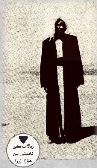
زهلامین تایینی یین هۆزا زهزا

۴. شەمەد : ئەفە نازکترین و نەرمترین پەرۆکە کو زهرزا د رپسن و ئەو گەلەک بالکیش و جوانە. رەنگ ئەوئ سبی سادەیا و هەندەک جارن خیج خیجی و زراف ب رەنگین سوو و زەر و شینن.