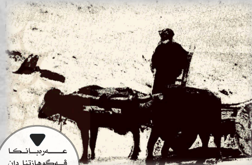
عەربانكا ڤهگۆھازتانا دان و دەككى ب چەرخين تايبەتئين خو

دەپتە بكارهينان د چەرخين ئەوئ دايه. چونكو چەرخين ئەوئ ل ڤيرى بى داركن و ب تنى قەدەك دارى يە كو ژ قورمى دارى چيدكەن و نيڤا ئەوئ كۆن دكەن و دارەكى د ئېخنە نيڤا ئەويدا و ئەڤى چەرخى لاستيك و هيچ تىشتەك دېتر تيدا نينه.