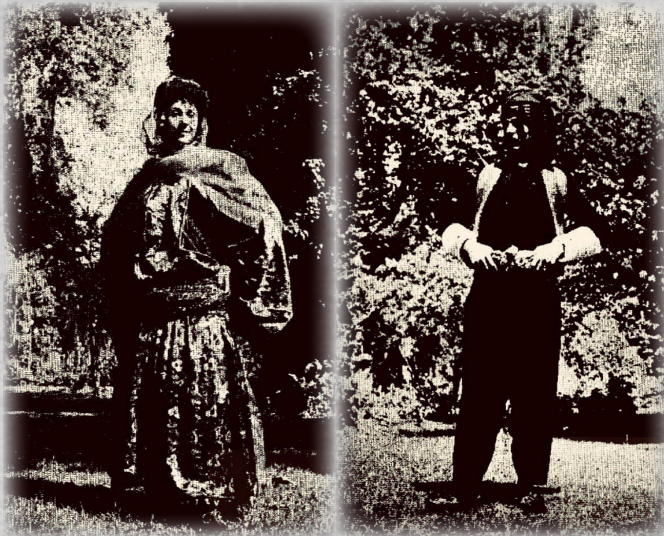
▲ ژن و زەلامەکی هۆزا زەرزا

۳. کراس: کراسی ژنێن زرزا ژ سەر ملی هەتا گۆزەکی دریزه کو کەمەرا ئەوی ب کوریشکە و هچکین کراسی فرهه و ب لهوهندینە. هەر دوو