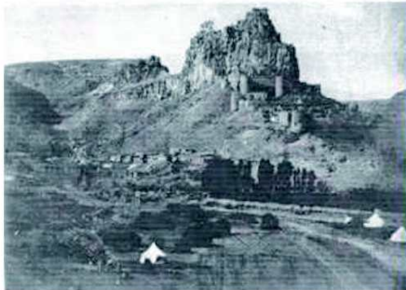
وینیه کی که قنی که لا چاریک (چهریق) نهوا میر عمادالدینی حوکم لیدکر