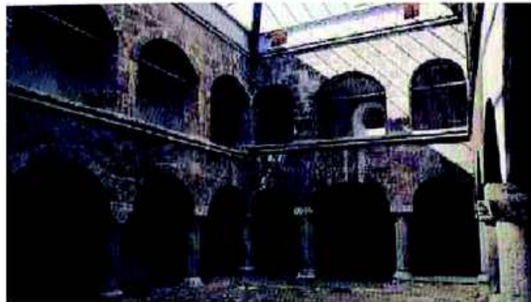
مه‌دره‌سا مه‌یدان Meydan

ژ ئەفا بوری دیار دبیت کو فهقیی تهران د نیقا ئیکی ژ سهدی هه‌ده دا هیشتا زیندی بوو و ئەفه رامانا هندی یه کو هه‌ردوو هوزانقانی دی (مه‌لایی جزیری و میر عمادالدین) ژی ده‌مان سه‌رده‌مدا ژبایه.