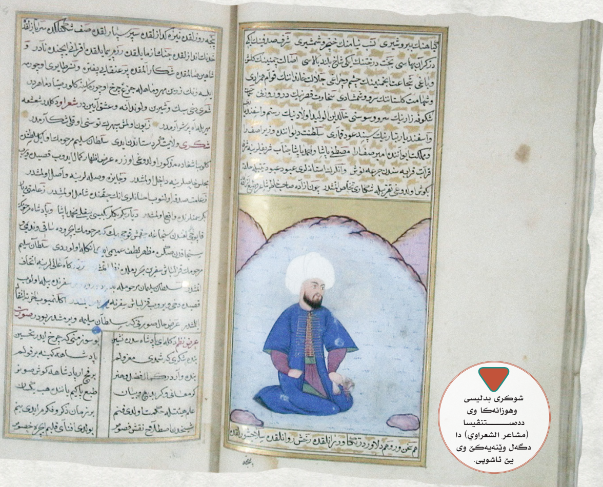
شوکری بدلیسی هوزانهکا وی دهسه تنقیسا (مشاعر الشعراوی) دا دگهل وینهیهکن وی یئ قاشویی.