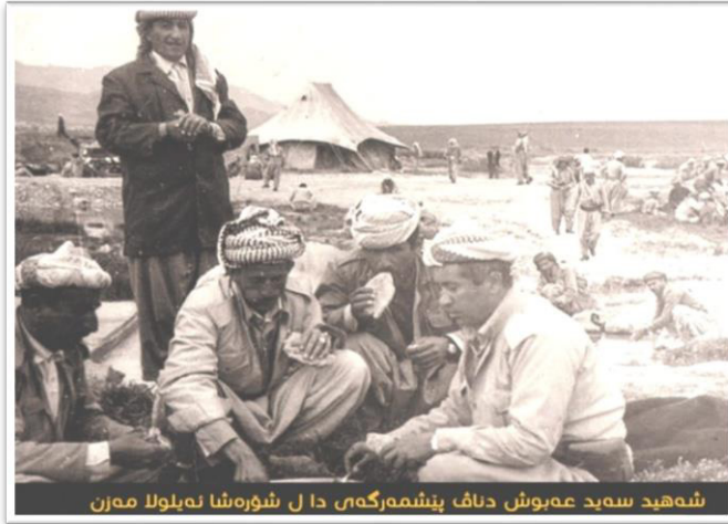
شهید سهید عبوش دناف پینشمه‌رگه‌ی دا ل شوره‌شا نه‌بلولا مه‌رن