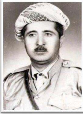
سهید عه‌بوش عه‌بدی غه‌زالا بیشمه‌رگه‌یی شوره‌شا نه‌یلوئی