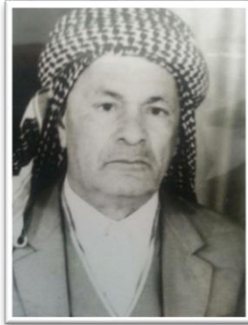
مه‌لا صالح بالقوسی کارگیری لقی 8 ل شوره‌شا نه‌یلوئی