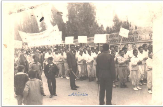
قوتابخانا زاخو یا نوی 1965