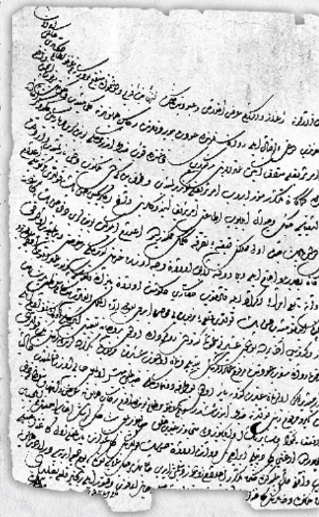
▲ نامه‌ها و هزیر قره موسته‌فا پاشا بو سلاحداری سولتان مورادی چواری