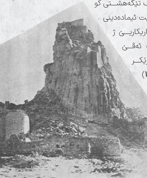
ديمه نه ك ژ كه لا چه ريق ئهوا مير عيماده ديني حوكم لئ دكر

ب تنه هيزا خوه قه نه شيت ئيماده ديني تيك بيه ت ناچار بوو هاريكاريئ ژ سه فهويان بخوازي ت و ب ئه قئ مه به ستنئ مروقه كي خوه ريكر نك شاه سه في (۱۶۲۹-۱۶۴۲) و هاريكاري ژئ خوه ست.