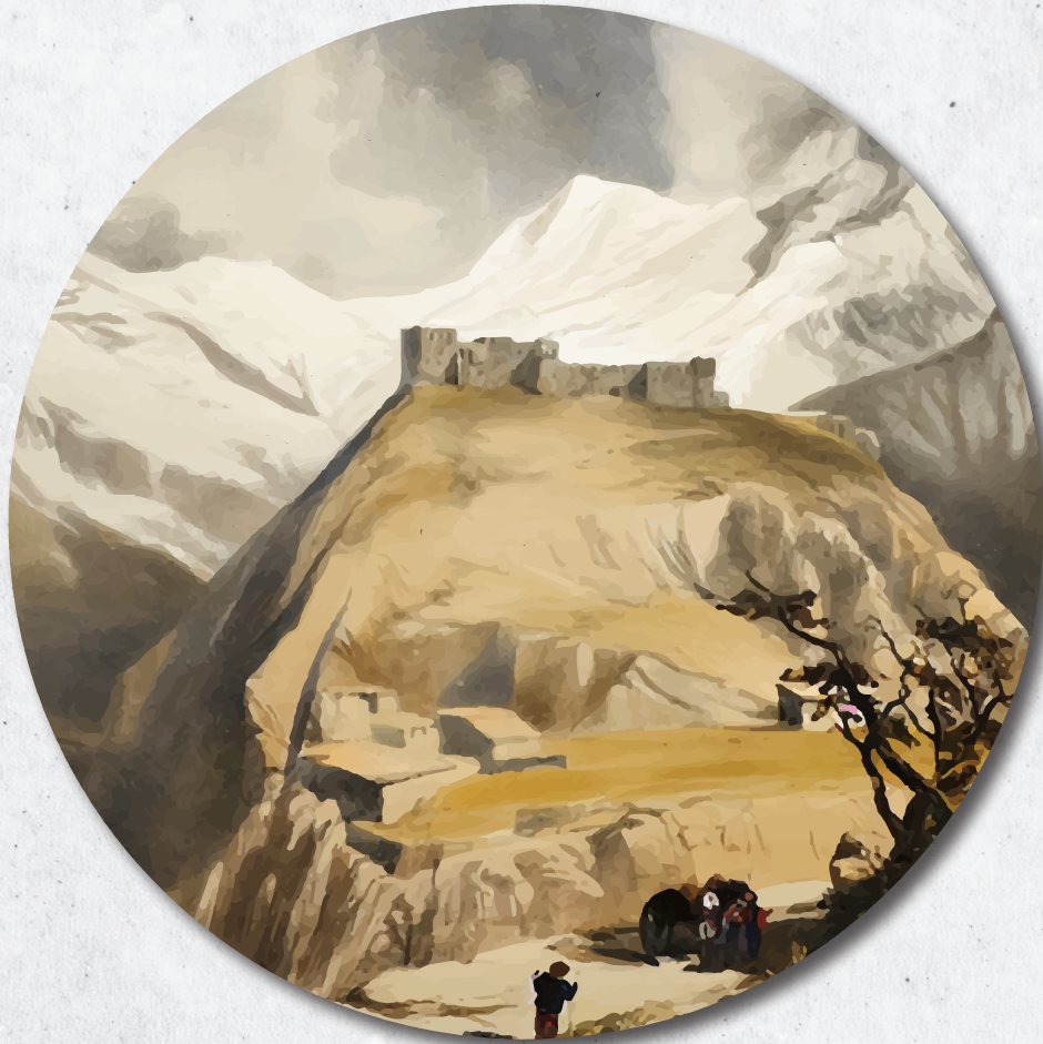
▼ وڻهه پڪي ديروڪيئي ڪهلا جولهه مڙڪي ۱۸۵۲

”دڙيدهرين عوسمانيدا ده رباريئي فه ترهيا مير اتيا ئيماده ديني ئاگاهيئين باش هه نه. ل دوو ئه فان ئاگاهيان مير ئيماده دين د ههوا عوسمانيان يا ب سهرداريا سولتان مرادي چاري (م. ۱۶۴۰) يا د سالا ۱۶۳۵ اي دا، ل دڙي سه فهويان شهرين سهرکه قتي ڪر نه، سولتان مراد پشتي ڳرتنا رهوان و ته بريز ده ما دهاته وائي، ل ئه لباڪي دانا و جابا مير ئيماده ديني رپڪر ڪو بيته هوزووري، مير ئيماده دين ل ڪهلا پيزاني بوو و ئهو ده ر گهلهڪ نيزيڪي جهي سولتاني بوو“