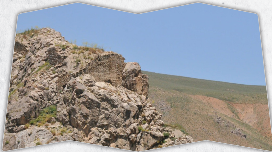
▼ دیمه نەك ژ كەلا (پیزانی)

شەره فخانێ هەر چەند بەره قانی کربیت ژێ کەله هاته ستاندى و ئەو ژێ هاته كوشتن (١٦٣٣-١٦٣٤). میر ئیماده دین ب ئەقى چەندئ نەراو هستا و دەه مان سالیدا كەلا پیزانی و كەلا چەلى ژێ ژ مامین خوه وه گرتن. ب ئەقى ئاوايى میر ئیماده دینی هەمی خاكا هەكاریان ئیخسته ژێر دەستى خوه. سولتانى عوسمانى خەلات و پيشكيش بۆ هنارتن و ههروهسا ئیماده دین كره میره میرانی قەرسى. ل گەل ئەقى چەندئ شاهى، سەفهوى ژێ دیارى بۆ ئەوى هنارتن و پرانیا میرین كوردان یین دەردۆرئ، خوه بۆ ئیماده دینی چەماندن. تەمەرى یازجى هەتا ئەقى دەرى بەحسكرنئ ژيانا میر ئیماده دینی دكەت و پاشى وه فات دكەت (١٦٣٣/١٦٣٤). ب ئەقى ئاوايى پرتووكا ئەوى نیچو مایه (٣) .