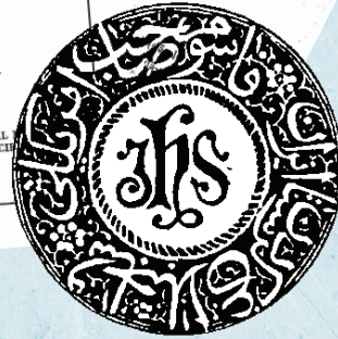
موهرا چنهال فاسومی

زیده‌باری نقیسین و وه‌گێرانیین دکتور فاسومی ، ئەوی د سالانیین جه‌نگی و ته‌نگاڤیی دا گه‌له‌ک هه‌وار و گازیین خو برینه لایه‌نن خێرخواز، به‌لێ پتیریا بزاقین وی بو بده‌ستفه‌ئینانا هاریکاریان بو گوردان بی ئەنجام بویه. بو نمونه لسالا ۱۹۱۳ئ ئەو چاڤه‌رئ ئاڤاكرنا نه‌خوشخانه‌یه‌كی بول مه‌بادئ، به‌لێ نه‌هاته ئاڤاكرن. دیسان ئەول هیڤیی بو چاپخانه‌یه‌ك ژ لایئ نه‌ته‌ویئ ئیكگرتی قه‌ به‌ئته دروستكرن بو هندئ په‌رتووکیین قوتابخانی بو خویندكارین كورد چاپ بکهت، به‌لێ ئەوژئ نه‌هاته بجه‌ئینان، و نه‌چار بو بده‌ست هنده‌ك ژ فان په‌رتووكان لدویڤ پیدڤیا هنده‌ك قوتابخانان ئاماده بکهت. له‌وما ئەو به‌رامبه‌ر ئەفان لایه‌نن خێرخوازی هه‌رده‌م یئ بی زار و بی هیڤی بوو.