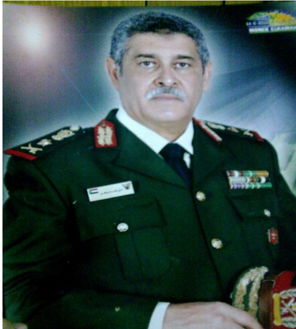
ملحق رقم ٢٨: الفريق الركن الدكتور علي محمد ابراهيم كردي