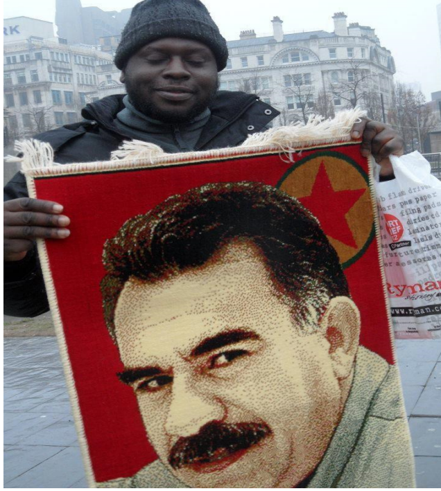
ملحق رقم ٢٥: كردي سوداني في احدى مظاهرات لتحرير عبدالله أوجلان في بريطانيا