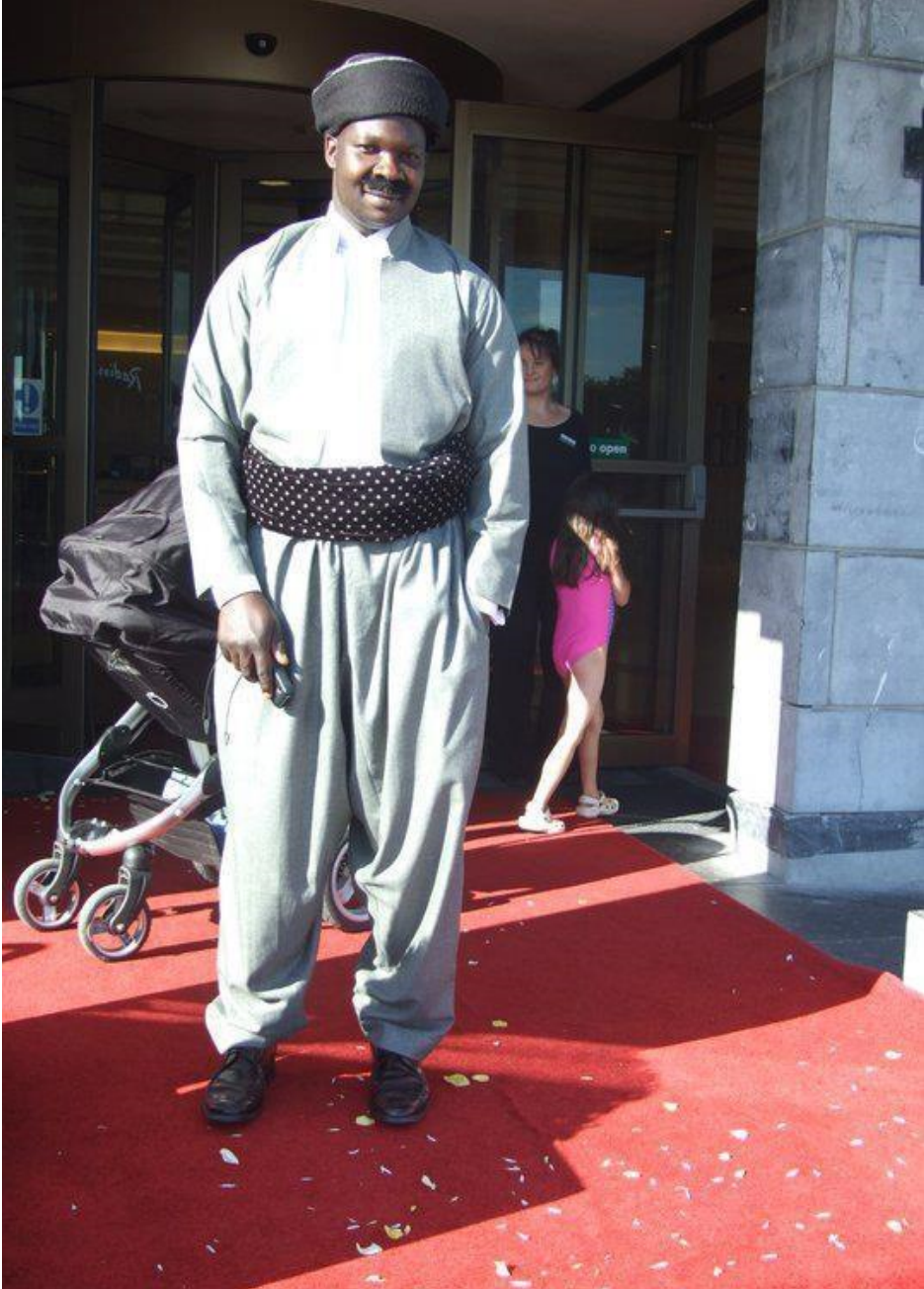
ملحق رقم ٢٤: كردي سوداني بملابس الكردية في بريطانيا