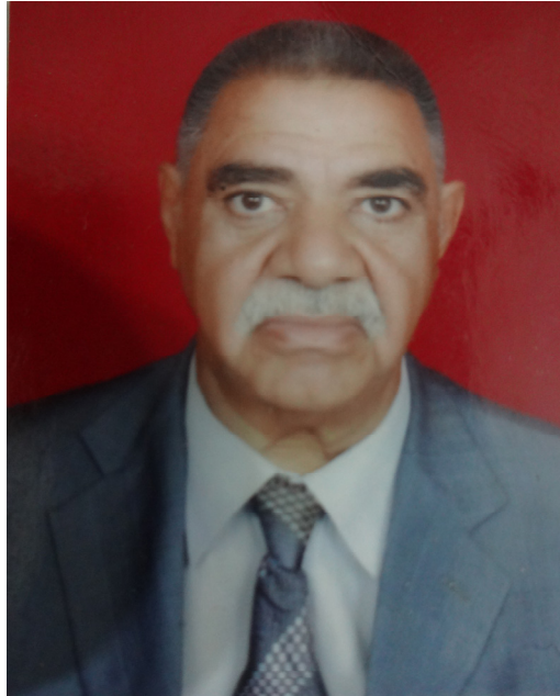
ملحق رقم ٣٨: القاضي عبدالعزيز محمد عوض الكردي