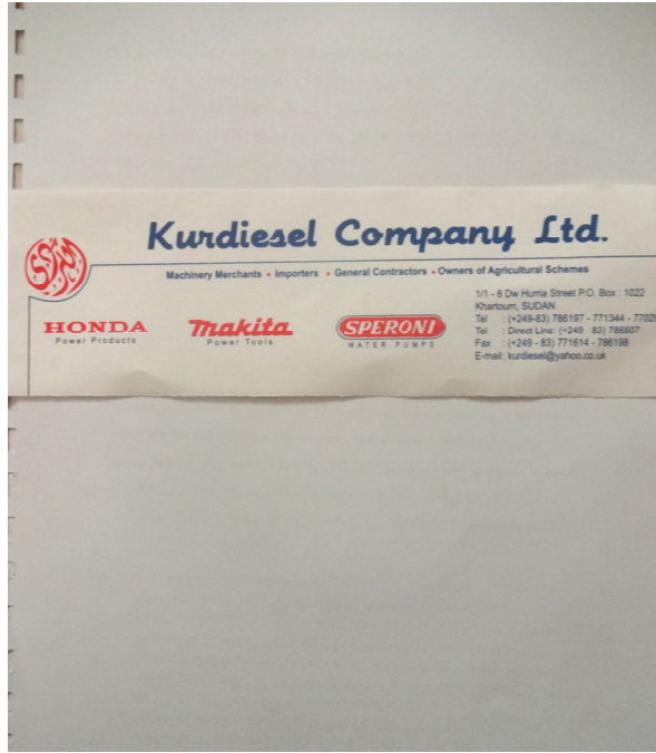
ملحق رقم ٢٩: شركة كرديزل في الخرطوم شارع الحرية