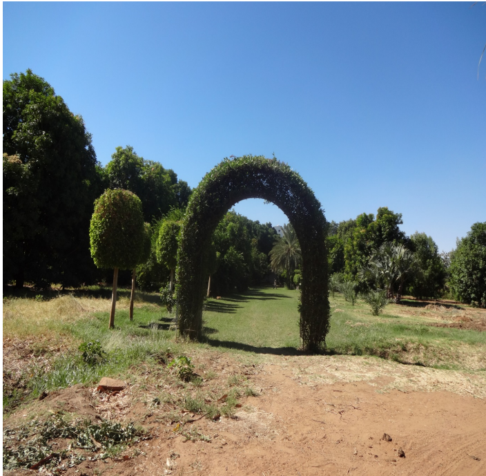
ملحق رقم ٢٠: مزرعة الكردي سوبا الشرق/ الخرطوم