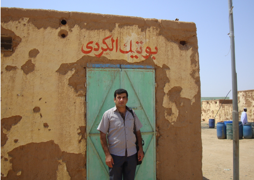
ملحق رقم ١١: الباحث أمام بوتيك الكردي في مدينة وادي حلفا/ حي الأول عنقش