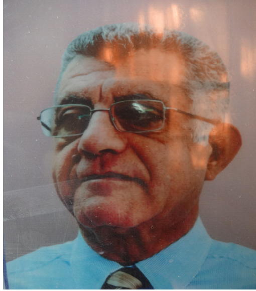
ملحق رقم ٣٧: البروفيسور احمد علي ابراهيم حمو