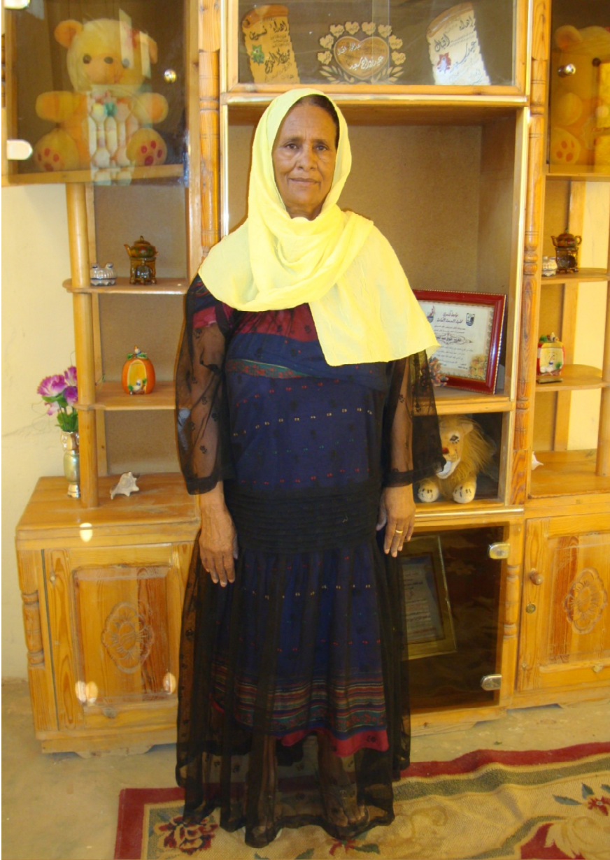
ملحق رقم ١٦: ملابس النوبية الشبيهة للملابس الكردية