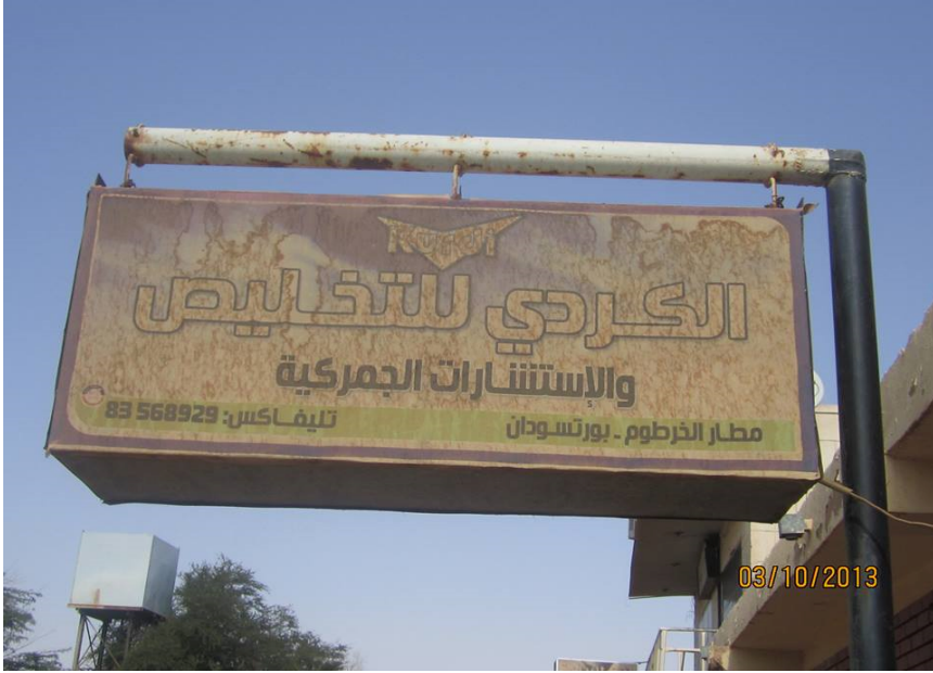
ملحق رقم ٢٣: الكردى للتخليص في العمارات/ الخرطوم أمام نادي ضباط