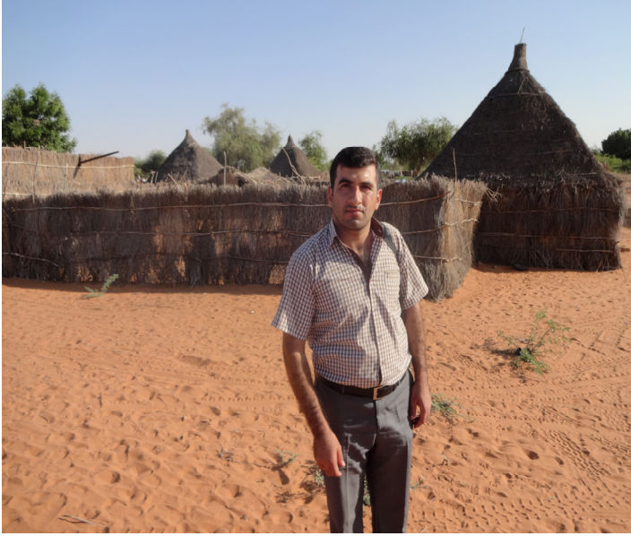
ملحق رقم ١٩: الباحث في قرية الكردي