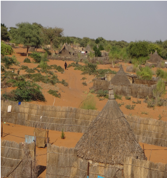
ملحق رقم ١٨: قرية الكردي في شرق مدينة بارا، ولاية كردفان الشمالية