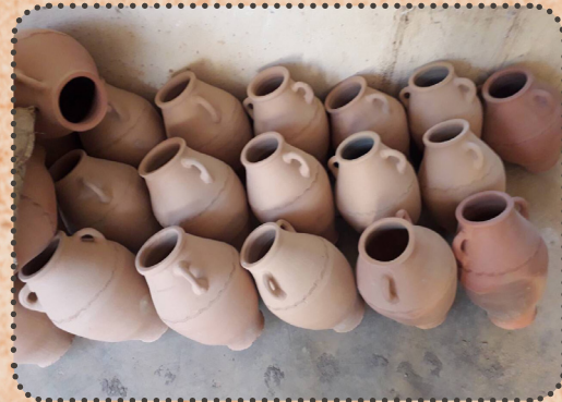
نموونە ز جورى ( سندان ) ئونىتان