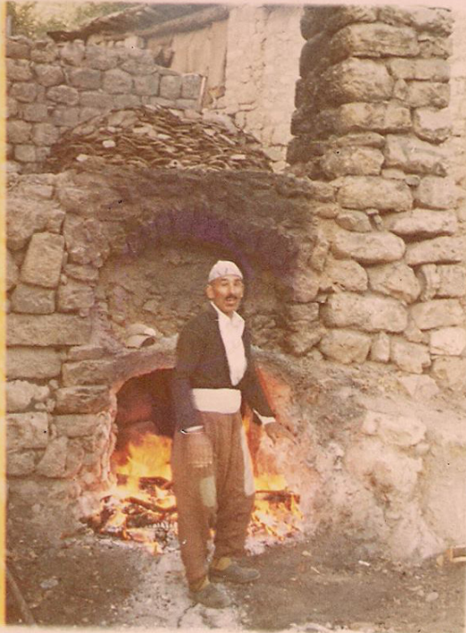
باپىرى ئقىسەرى (مخو زکە) بەرامبەر ئاتونى دا دەمى قەلاندا کلوسکان

پشتى فەخارى دەھینە ھشککرن پىدقى ب سۆتنيیە دا کو بکیر بکارئینانى بەین و ھەرەمسا پتر موکم وقایم دبن، بۆ ئەقى مەبەستى زى دى ئامانى داننە ئافى فرنەکا تايبەتدا ئەو فرنا ل گوندى درکنى دەھیتە بکارئینان دىبژنى ئاتونا (تور) ئەف قوناغە ب دووماھىک کریارا چیکرنا فەخارى دەھیتە ھژمارتن، ئەف ئامانە بۆ ماومى نە ژ ھەپشەكى کىمتر یان پتر دەمیننە وەسا ، دا کو ھەمى وەكى ئىک ھشک ببن ، نابیت بەھینە ئىتوین کەرن بى ھشک کەرن ، پشتى ھشککرنى بۆ جھەكى دىتر دەھینە قەگۆھاستن بۆ ئىتوینکرنى ، دى داننە دناف بەرمیلەكى دا یان دناف ئامانین مەزن مەزن دا نەشکىن و بەھینە پاراستن ، پاشى دى کەنە دناف فرنى (تور) دا و ئاکرى بۆ چەند دەمژمىزان شارىنن و پاشى دى فەخارى جىبن و ب ھشبارى دى زى ئیننە دەر دا کو فەخارىەکا بەیز جىبیت بکیر بکارئینانى بیت.