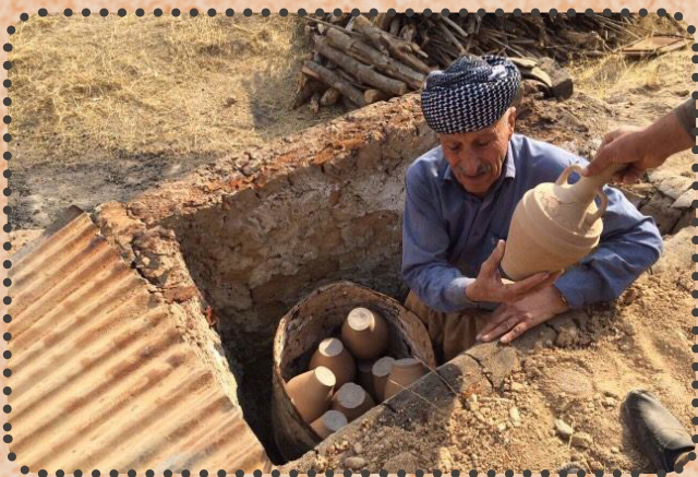
(ايشورده) موختارى كوندى درگنى ودانانا كلوسكا دناڧ ئاتونى دا

ديسا ھىشتا كەلەك جۇرىن ديتەر يىن ئامانېن درگنى يىن ھەين مە ژ بەر كەلەكيا وان ھەمى نەگوتن و ھەمە جۇريا بكارئىنانان وان ل وى دەمى بۇ نموونە بۇ مەرەمىن لىنانى و كەل و پەلېن قەخارنا چايى (ئىستكانى چايى) يان گلاسى چايى يى شووشەي و قورىكى چايى (چادانك) .