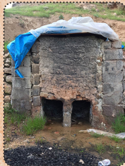
ئاتونا تەئىرى خەلكى گوندى درگنى بو قەلاندنا فەخاران