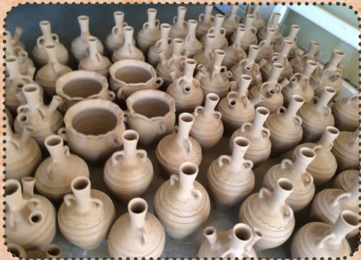
جورتن جىواز ژ ئامانن فخارىيىن گوندى درگنى

ئاكنجىيىن ۋەلاتى دناقبەرا دوو رووباران (بلاد مابىن النهرىن) (شارستانيا كەقن) ۋەك پىدقيا تىەك ھەر زوى دەستپىكرىە و ب شىۋەيىن جودا جودا بۇ مەرەمىن پاراستنا خارنى و قەخارنى و پىدقيا تىيىن دىتر يىن ژيانا روژانە ۋەك چاندن و نىچىرى و شقانبا پەزى ، و دەمى پىشەسازيا دەستپىكى بوو پە ئالاقەك بۇ پركرنا پىدقيا تىيىن خەلكى و دىنىات دا نەخودان رەھەندەكى جوانىيى ، فەخارىيىن گوندى درگنى ژ پىدقيا تىيىن فەربوو بۇ ھەر مالەكال دەقەرى بۇ بكارئىنانا كەلەك مەرەمان ژ وان ژى بۇ پاراستنا كەرستەيىن خارنى و ئاقا قەخارنى و جوانكارىيى كەلەك مەرەمىن دىتر ، و ئەق پىشەسازىە پتر ژ پىشەسازىيىن دىتر ھاتىە بكارئىنان ، لەوما داخوازىيىن ل سەر