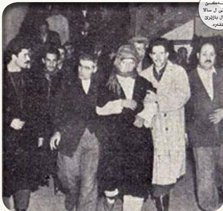
وینهکی پهحمهتی ل سالا ١٩٥٩ ل باژیرئ ئهنههه.

ل دوور بابته مهازئ پهحمهتی گهلهک ئاخفتن یئن هاتینه گۆتن، بۆ نمونه: ل سالا ١٩٩٣ ئهندام پههلهمانئ پارتا دیموکرات (عصمهت بوزداغن) دیار دکهت: بهریرسئ پاراستنا نشتیمانی ئهدههم مهندهرئسی بۆ ئهوی دیار کرییه کو ل دهمی