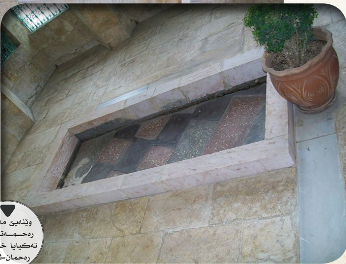
وینەيىن مەزارى پەحمەتى ل تەكبايا خەلىپول پەحمەن-ئورفا