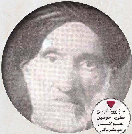
مېزوون نقيسين كورد حوسين حوزنى موكرىانى

مە ژبەر نافەئئ وان غەمزەئئ چاقين دبلەك زارى وئاهى مە بورينە، ژنەھ چەرخی فەلەك