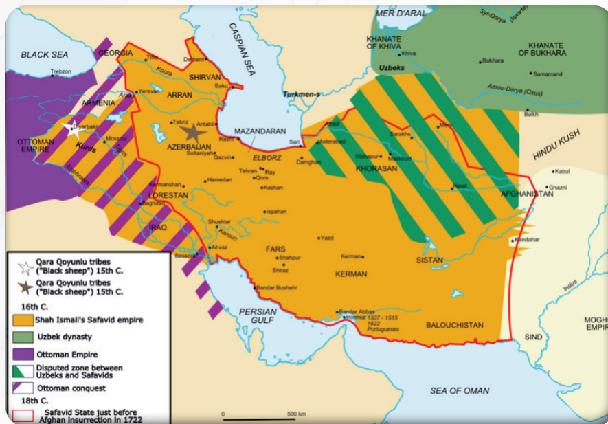
نهخشهئ ههقرکیئین ئیران و ئوسمانیان

”ل ئهوی دهمی شهرفخان هاتیه کوشتن پهیوهندی دناف بهرا ئوسمانی وسهفهویاندا گهلهک خراب بوون، وههه ئهف چنده ژئ تهگهرهک بوو ژ تهگهرئین کوشتنا ئهوی“