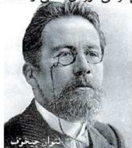
ئان تون چیخوف

چه رخی نۆز دی هاتی و ئاشکرا کر کو ژیا ن چه ند ساته کین سه ر پیی یین کورتین جودانه (لحظات عابرة) کو ته نها کورته چیروک“ دگه ل دگونجیت. ل ده ف وی ویناندنا رویدانه کا ده ستنیشانکری دکه ت و نقیسه ر گرنگیی ب پیش و پاش خوه ناده ت... ئه و نقیسه رین کو پشتی (موپاسان) ی هاتین، وه کو (ئه نتوان چیخوف، کاترین مانسفیلد، ئیرنیست